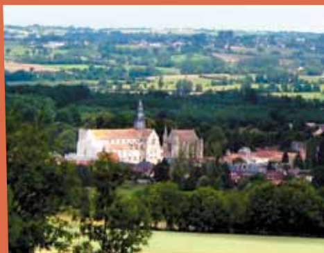
ABBAYE DE ST GERMER PÈLERINAGE PAROISSIAL À ST WANDRILLE